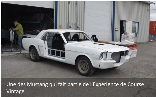
Une des Mustang qui fait partie de l'Expérience de Course Vintage